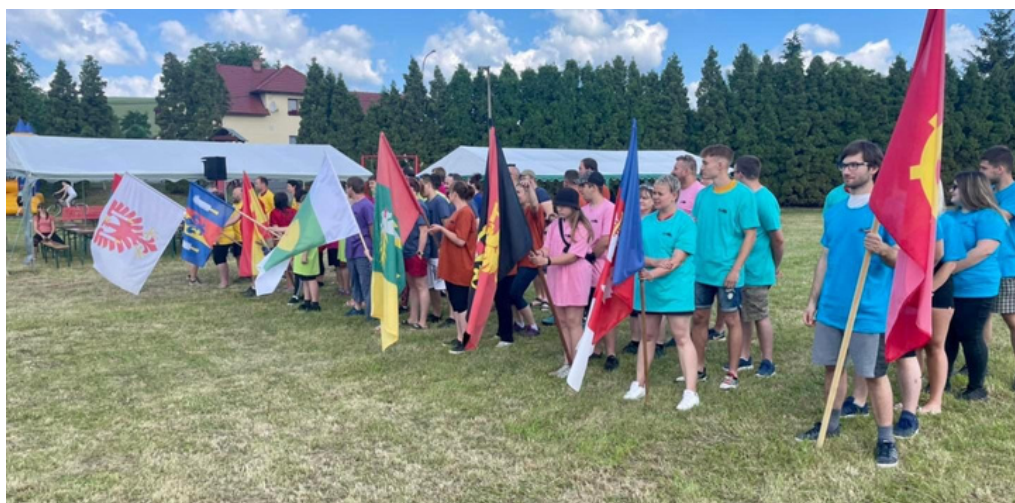
HRY VLADYKY OPROSTY - Hry 2022

Setkání obcí se letos uskuteční v obci Žákovice dne 20. května 2023 od 9 hodin. Nebude chybět ani soutěž ve vaření - vařit se bude Dršťková polévka.